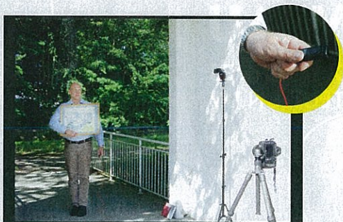
TEXTE YVES LASSUEUR

BRIMADES Les violences entre mineurs se multiplient. La mode du «bullying», consistant à martyriser psychologiquement l'autre, se répand en particulier de façon préoccupante, dénonce le psychologue.