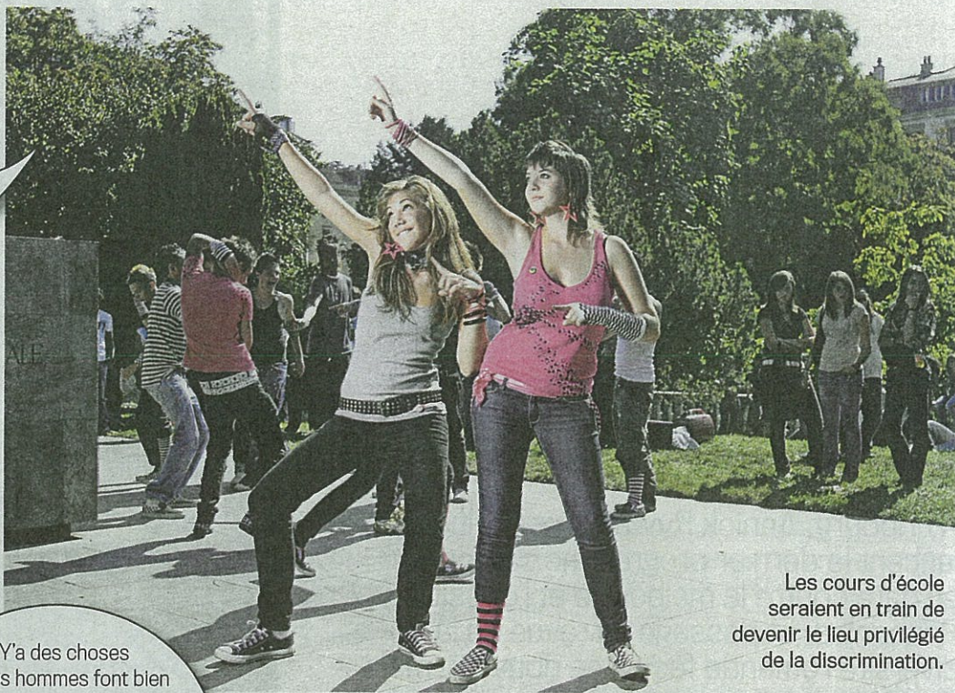
Les cours d'école seraient en train de devenir le lieu privilégié de la discrimination.

➔ dans tous les lieux de vie et à tous les niveaux, y compris celui des structures sociales.»